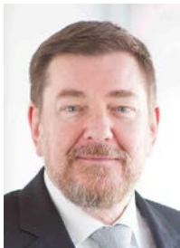
Autor: Prof. Dr. Florian Schumann, Geschäftsführer INTERcept Solutions GmbH

Kunden-Service-Center der Zukunft. Neue Konsummuster erfordern Anpassungsprozesse in vielen Branchen – auch die Sparkassen- und Bankenszene ist hiervon betroffen. Konsolidierungsmaßnahmen lassen sich mit Blick auf die Wettbewerbsfähigkeit nicht länger aufschieben. Kunden-Service-Center (KSC) geraten als strategisch bedeutsame Vertriebsplattformen damit zunehmend in den Fokus.