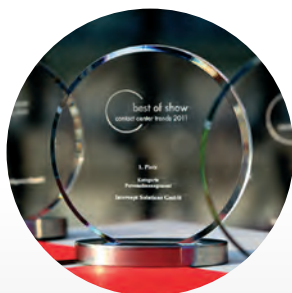
Best-Of-Show Award Kategorie Personalmanagement Contact Center Trends

fuzzy logic , „unscharfe Logik“, wird für die Modellierung von Unsicherheiten und Unschärfen angewandt. Sie wird in vielen unterschiedlichen Bereichen eingesetzt, u.a. in der Automatisierungs- und Regelungstechnik, der Unterhaltungselektronik, bei Forschungen zur Künstlichen Intelligenz und in der Betriebswirtschaft, wenn es um aufwändige Prognoseverfahren geht.